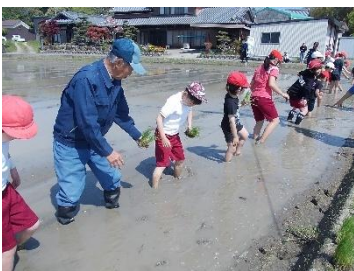
体験活動「全校田植え」

小規模校であることを活かし、縦割りでの班活動を多く設定することで、全校児童が深く関わり合いながら学校生活を過ごしている。あたたかい雰囲気があり、上級生が下級生に優しくサポートできている。下級生はそうした経験をもとに、上級生になった時に下級生に自然と優しくできている。しかし、穏やかな関係を築く反面、お互いに切磋琢磨し、意欲の向上を図ったり、目標を目指したりしていく雰囲気は少ない。