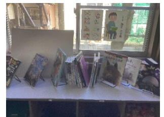
「ワンダーコーナー」