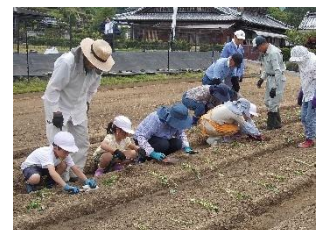
1・2 年体験活動「いもさし」