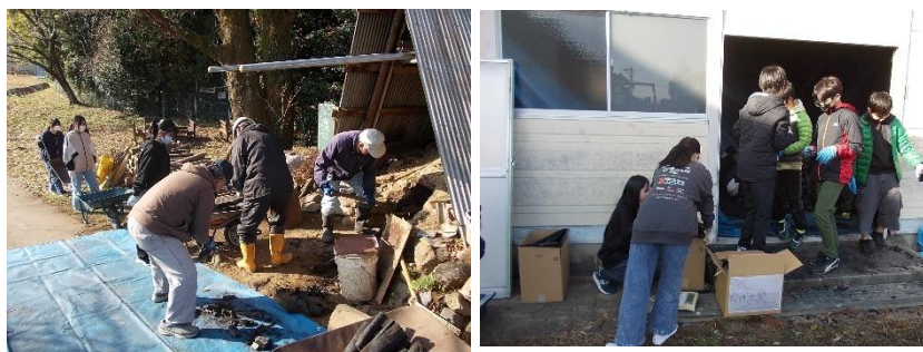
5・6 年体験活動「炭作り」