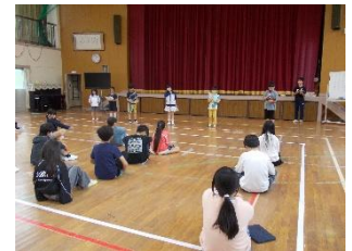
児童集会「白川っ子タイム」