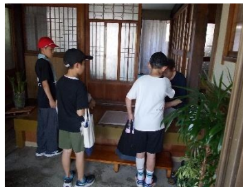
体験活動「3・4年お年寄り訪問」