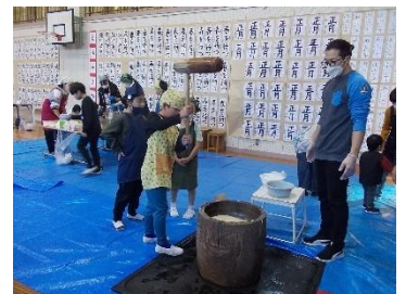
体験活動「餅つき集会」