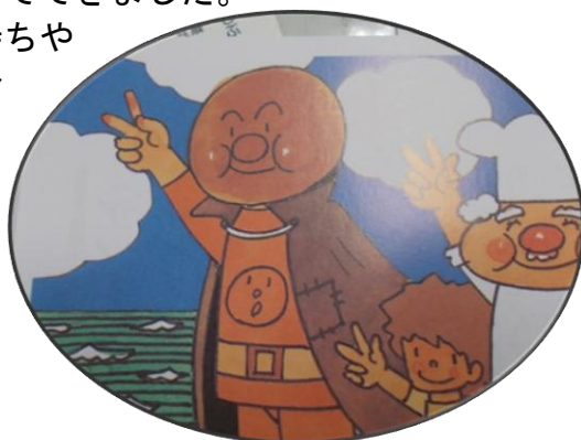
やなせ たかし作・絵「あんぱんまん」

これからも、こうした周りの人への感謝の気持ちや人に優しく接することの意味を考えながら、自分達の生活を見直していく、よい機会になればと思っています。