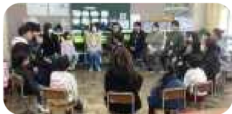
フルーツバスケット