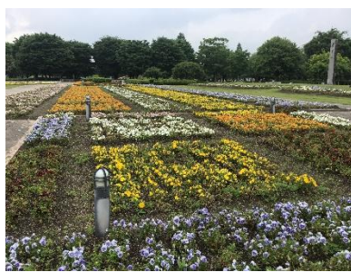
左・亀山公園 右・鈴鹿フラワーパーク