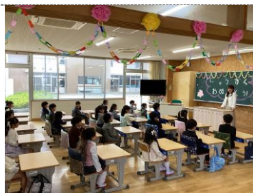
新しい学びが始まります