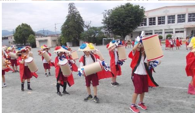
かんこ踊り ～運動会練習風景から～

7月23日（日）から、まちづくり協議会主催の「川崎ふれあい文化祭」が始まります。そのオープニングで、今年も、3・4年生有志の子どもたち24人が「かんこ踊り」を披露します。川崎地区コミュニティセンターの前庭で、23日（日）10時から出番です。よければ、是非応援を。