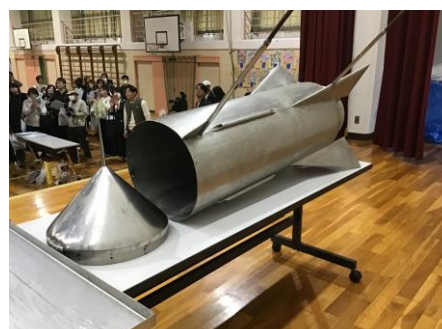
<タイムカプセル開封>