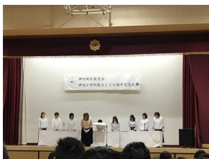
＜ハンドベルの演奏＞