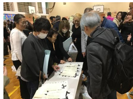
＜タイムカプセルに見入る卒業生＞ →