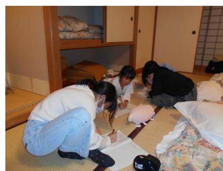
<宇多野ユースホステル>