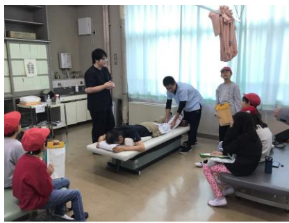
＜盲学校：はり・灸実習＞