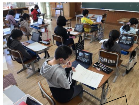
タブレット越しの授業風景です。

3学期も残すところ1か月余りとなり、各学年では、1年間の学習のまとめに拍車がかかります。6年生は、卒業式の練習も始まっています。児童会では、新年度の役員選挙があり、来年度の児童会役員さんが決まったところです。いろいろなところで、新年度へのバトンタッチが行われつつあります。