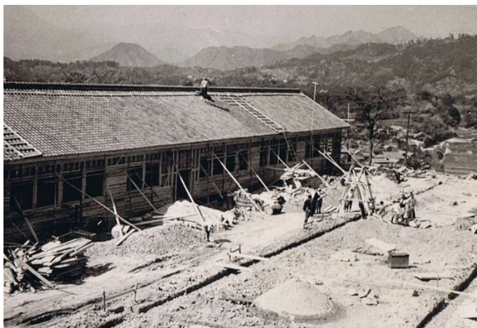
昭和28年 小学校屋根工事。(小学校提供)