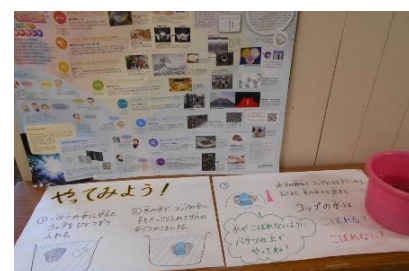
「ワンダーコーナー」