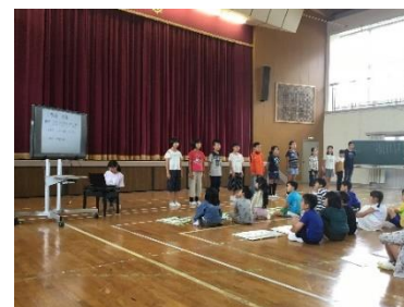
児童集会「白川っ子集会」