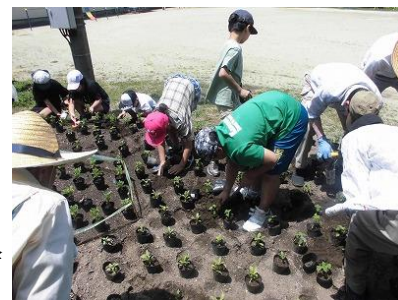
3・4年体験活動「花壇移植」