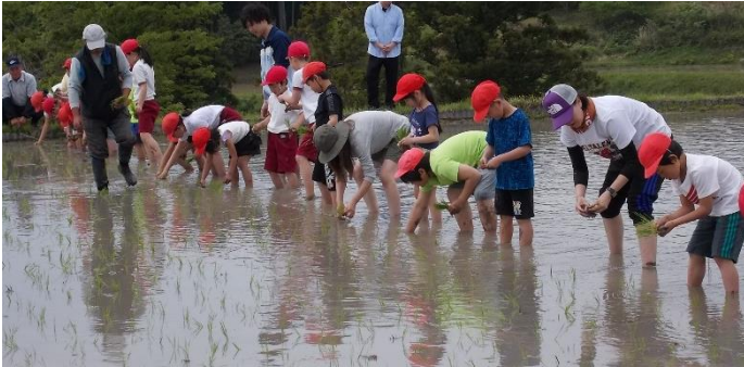
体験活動「全校田植え」

小規模校であることを活かして縦割りでの班活動を多く設定し、全校児童が深く関わり合いながら学校生活を過ごしている。そのなかで、上級生が下級生の世話をする機会が多く、活動をリードする姿も見られる。あたたかい雰囲気があり、上級生が下級生に優しくサポートできており、下級生はそういった経験をもとに、上級生になった時に下級生に自然と優しくできている。しかし、穏やかな関係を築く反面、お互いに切磋琢磨し、意欲の向上を図ったり、目標を目指したりしていく雰囲気が少ない。