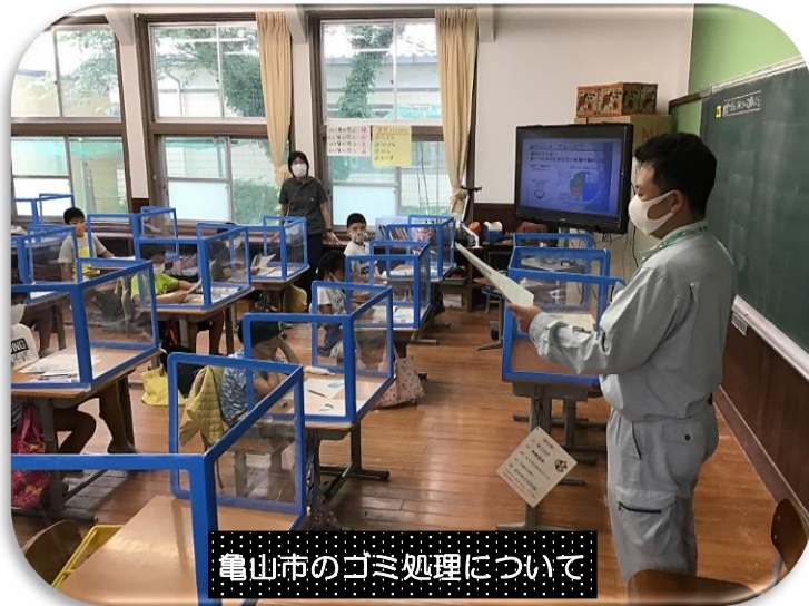
亀山市のゴミ処理について

今、4年生の子どもたちが社会科の学習で「くらしとゴミ」について学習しています。7月1日(水)市環境課より本校の生ゴミ処理機を使って、給食の廃材料(野菜の皮等)を他のエネルギー源として有効利用(学級園のたい肥として)する様子や市環境課の方からの授業の取材がありました。ZTVで放映(放送日は上記)されますので、是非ご覧ください。次回は7月8日(水)に子どもたちが市環境センターを訪れ実際にゴミがどのように処理されているかを自分の目で確認してきます。