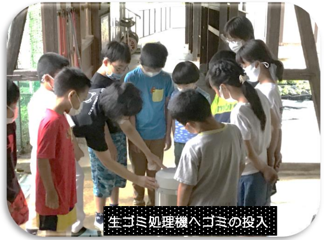
生ゴミ処理機へゴミの投入

○Reduce(リデュース)は、製品をつくる時に使う資源の量を少なくすることや廃棄物の発生を少なくすることです。