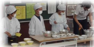
子どもたちと配膳準備