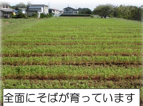
全面にそばが育っています

8月18日(日)に、3、4年生の子どもたちと保護者の皆さん、地域の方が種まきをしたそばが、種まき後、約3週間という時間が経ち、赤紫の茎が30~40cm程に成長し、小さな白い花がつきはじめています。10日(火)子どもたちが観察に行きました。秋が深まるにつれて結実して収穫となります。順調に成長してたくさんの実をつけてもらいたいです。