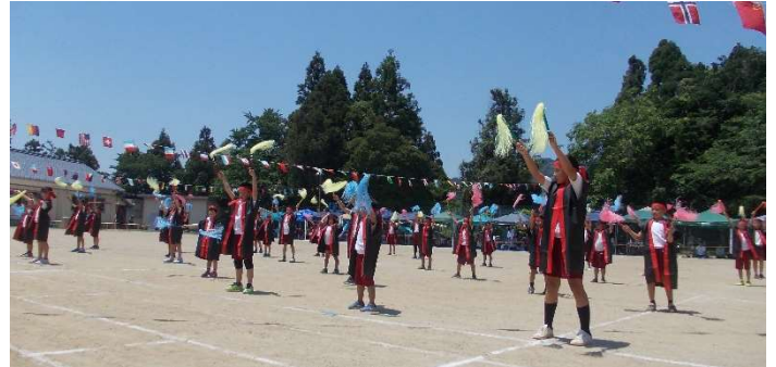
白川小白川地区運動会「表現運動」