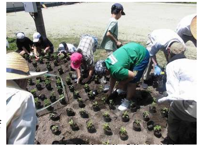
3・4年体験活動「花壇移植」