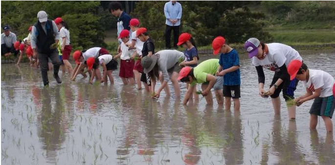
体験活動「全校田植え」

小規模校であることを活かして縦割りでの班活動を多く設定し、全校児童が深く関わり合いながら学校生活を過ごしている。そのなかで、上級生が下級生の世話をする機会が多く、活動をリードする姿も見られる。あたたかい雰囲気があり、上級生が下級生に優しくサポートできており、下級生はそういった経験をもとに、上級生になった時に下級生に自然と優しくできている。しかし、穏やかな関係を築く反面、お互いに切磋琢磨し、意欲の向上を図ったり、目標を目指したりしていく雰囲気が少ない。