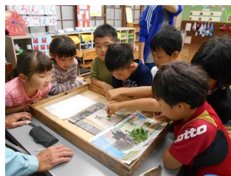
1・2年「カイコの飼育」