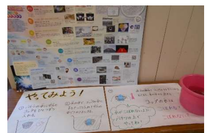
「ワンダーコーナー」