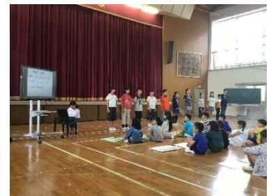
児童集会「白川っ子集会」