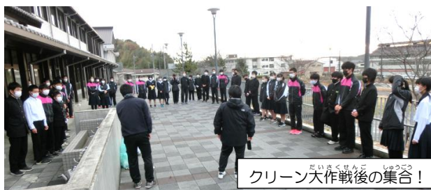
グリーン大作戦後の集合！

前号で紹介しました中庭の瓦の正解は「雪止め瓦」でした。積もった雪が落ちてきてケガをしないようになっています。知ってましたか？