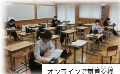
オンラインで意見交換

関中学校の代表のみなさんは、本校の制服改定の取組や校則見直しの取組などを積極的に発表していました。この経験を活かして、今後の関中の生徒会活動を進めてほしいと思います。