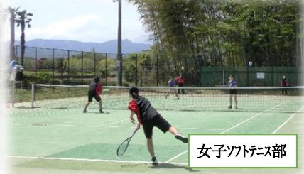
女子ソフトテニス部