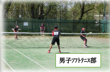
男子ソフトテニス部