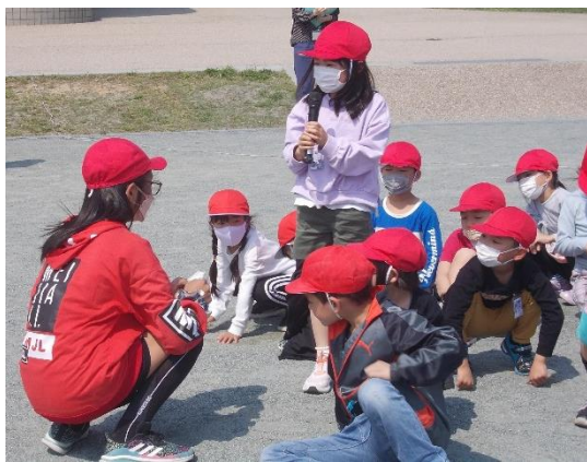
インタビューに上手に答える1年生