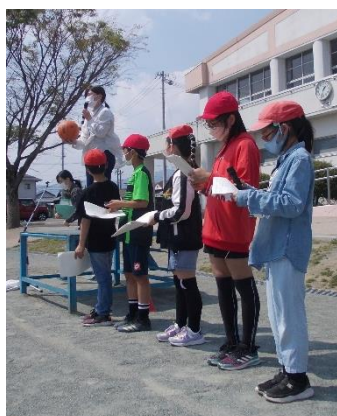
児童会役員さん初仕事

1学期が始まって、20日ほどたちました。子どもたちは新しいクラスにも慣れつつあるようです。4月20日(水)には、「1年生を迎える会」がありました。感染防止のために運動場で行いました。児童会の役員さんたちが考えた〇×クイズを楽しみました。学校のルールや先生に関する問題が出され、〇か×かを考えました。クイズに正解した子どもたちは大喜び。最後に1年生へのインタビューもありました。児童会の役員さんたち、準備や司会進行ありがとう。みんなが楽しめてよかったです。