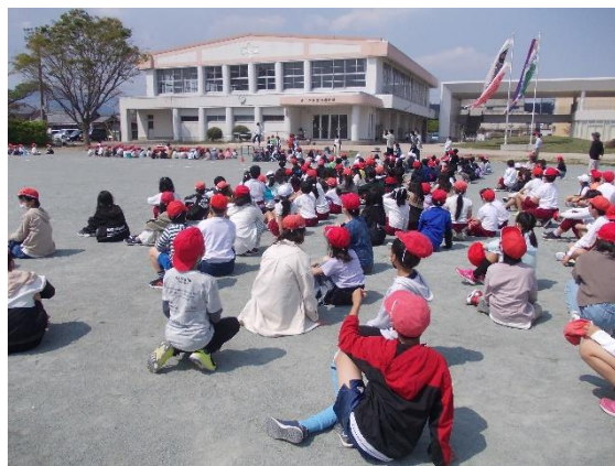
楽しい〇×クイズがたくさんありました