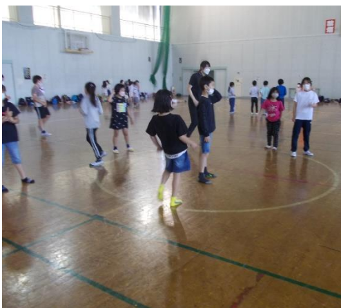
3. 4年生は、東野公園へ。体育館も貸していただき、ドッジボールやバドミントンなどを楽しみました。