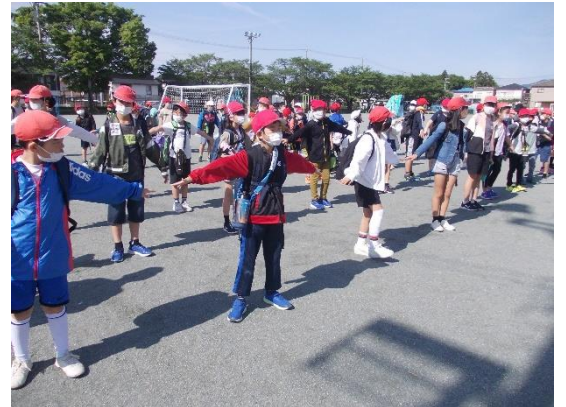
出発前に運動場に集合。両手を広げて密を避けました。

昨年度は、新型コロナウイルスの影響で、急遽、フラワーパークから東野公園に行先を変更するなど混乱しましたが、今年度は、フラワーパークも含め、予定していた場所で楽しく過ごすことができました。どの子もしっかり体を動かして、元気な様子があちこちで見られました。子どもたちの笑顔がいっぱいで、みんな満足。大きな事故もなく遠足を終えることができました。お弁当作り等、おうちの方にはご負担をおかけしました。ありがとうございました。