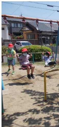
1. 2年生のみんなは、遊具で大はしゃぎ。元気いっぱい。