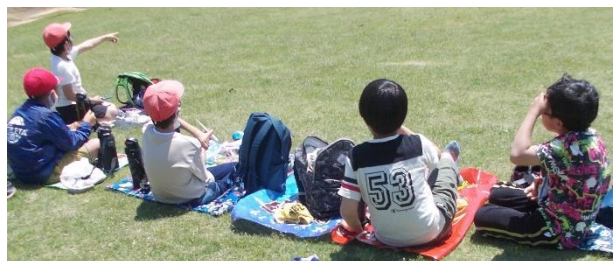
5, 6年生は、鈴鹿フラワーパークへ。間隔をあけてのお弁当。