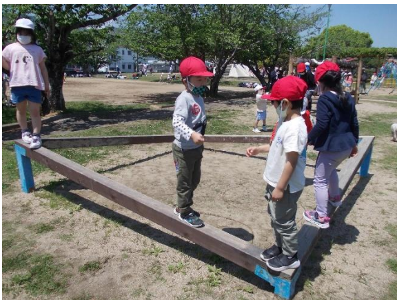
1. 2年生は、ふぐ太郎公園へ。マスクをきちんとしながら遊びました。