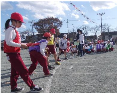
緊張のスタート！「気持ちのバトンをつなGO！」(5.6年)