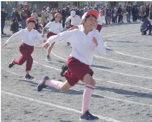
かいっぱい走る姿がいいです。