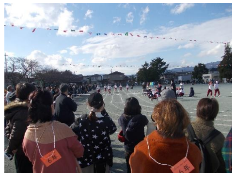
多くの方々に応援されて子どもたちも大満足でした。ありがとうございました。