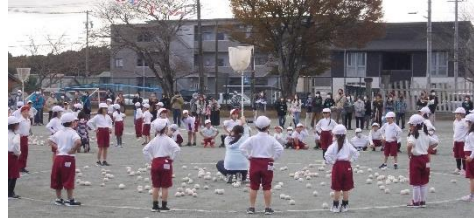
玉入れしたり、踊ったり・・・。「チェッコリ玉入れ」(1.2年)