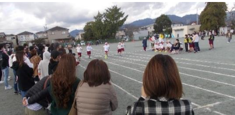
各学年の徒競走は注目の的。