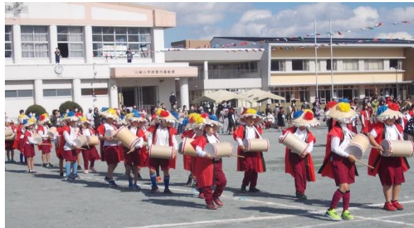
華やかな かんこ踊り。「踊れ・歌え・奏でろ・繋いで創れ」(3.4年)