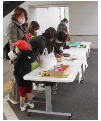
役員さん、部員さんによる受付。