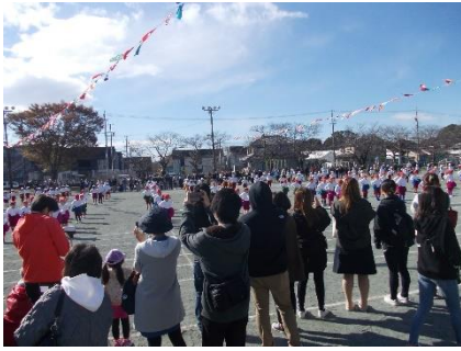
おうちの方々に披露。「It's our stage ~ 主役はわたしたち」(1.2年)