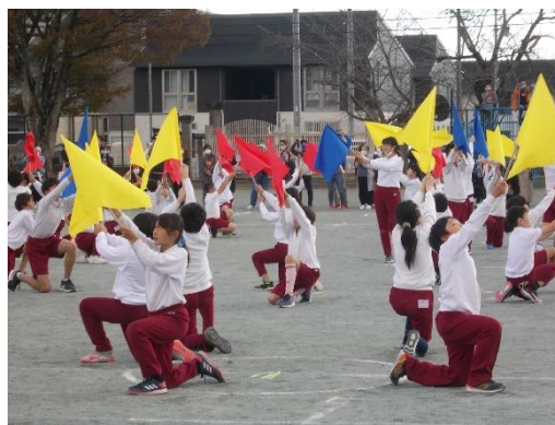
Challenge&Yell!! (5.6年) 音楽に合わせてはためく赤・黄・青の旗がきれいでした。