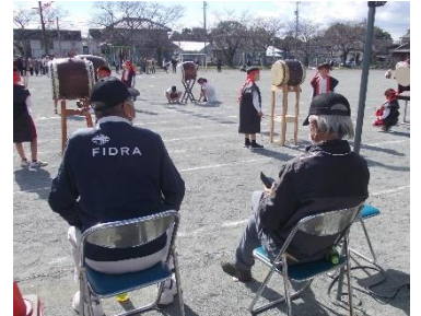
かんこ踊りを教えてくださった元田村地区かんこ踊り保存会の方も駆けつけてくださいました。