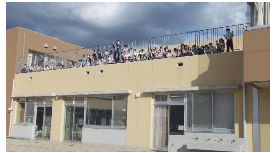
2階ベランダからも声援が・・・。