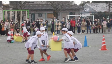
「運び屋プッチン」(3.4年) 途中でダンスタイムがあって、なかなか運べない。