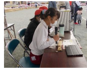
6年生は係活動にもがんばってくれていました。ありがとう。