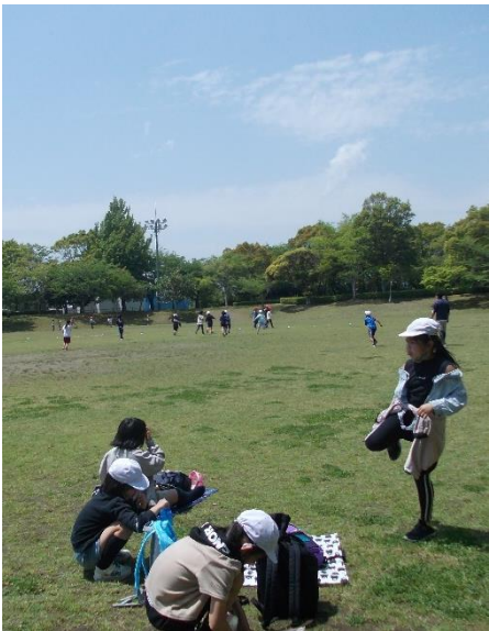
いいお天気よかったです。