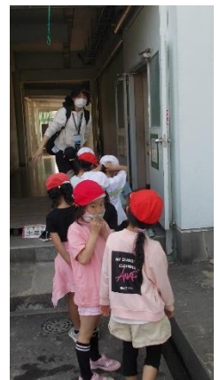
トイレを借りたり、休憩させてもらったりするなど、井田川小学校さんに大変お世話になりました。