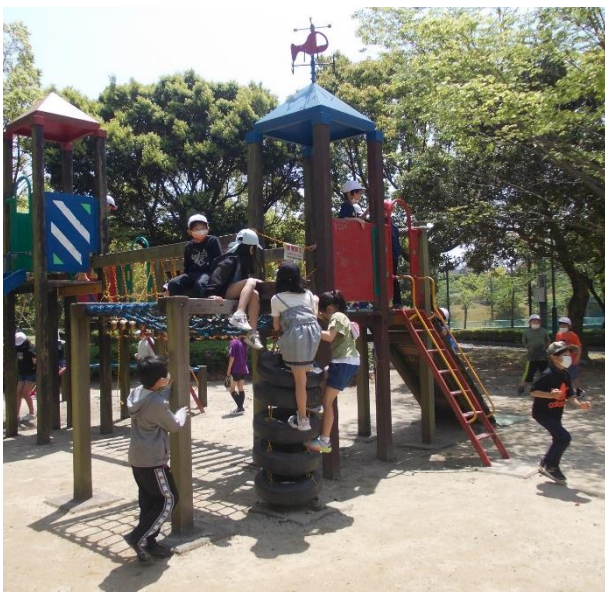
遊具は大人気です。思いっきり体が動かせて、元気いっぱい。