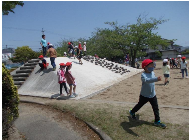
マスクをきちんとしながら遊びました。