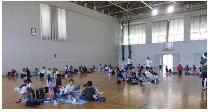
5、6年生は、昼食中の密を少しでも減らすため、体育館でお弁当を食べました