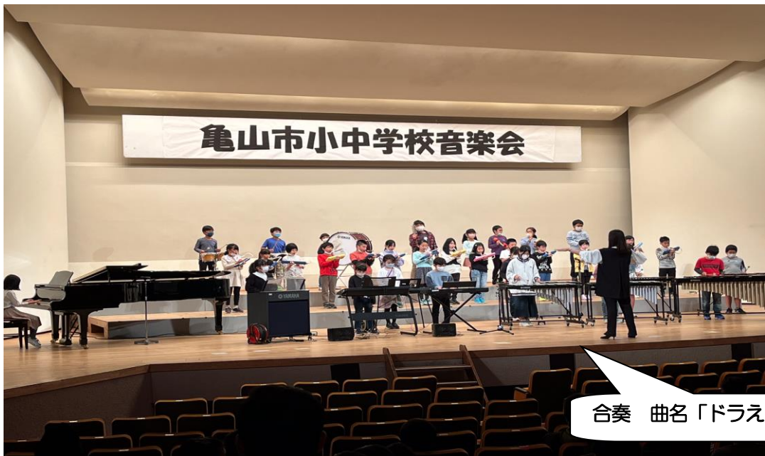
合奏 曲名「ドラえもん」

2学期も残すところ1ヶ月ほどとなりました。先月、6年生は、鳥羽・伊勢の修学旅行を終え、たくさんの方に残る思い出をつくることができました。また、先日は、3・4年生が、3年ぶりに開催された亀山市小中学校音楽会に出演し、大ステージで練習の成果を発揮し見事な合奏を披露してきました。一生懸命練習し心と音を合わせて、本当に素晴らしい演奏でした。コロナの感染拡大防止に努めつつ、教育活動の充実に向け取り組みを進めています。