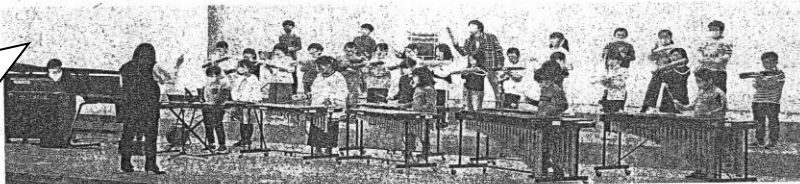
合奏を披露する神辺小の児童ら＝亀山市東御幸町の市文化会館で