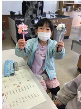
<フラワーアレンジメント>