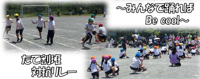
たて割り班 対抗レー