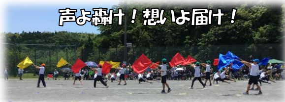
声も轟け！想いは届け！