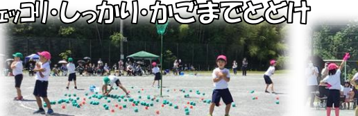
チェリーボール・しっかいかごまでとどけ