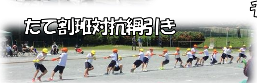
たて割り班対抗綱引き