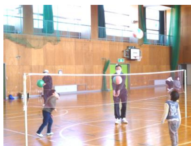
【ソフトバレーボール】