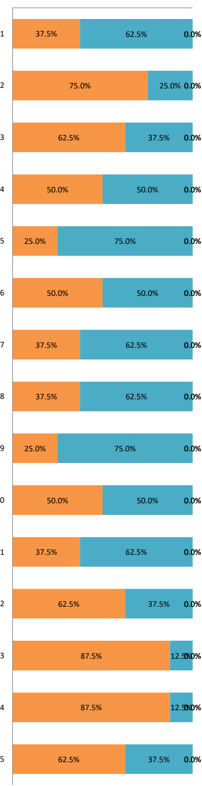
R2 地域関係者アンケート結果