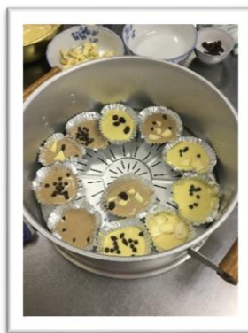
蒸し器を使いま した!