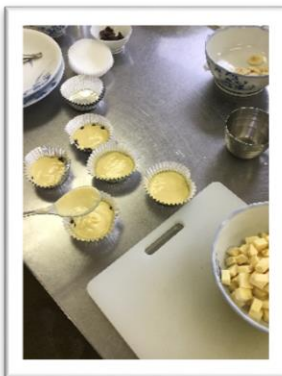
カップに入れて トッピング♪