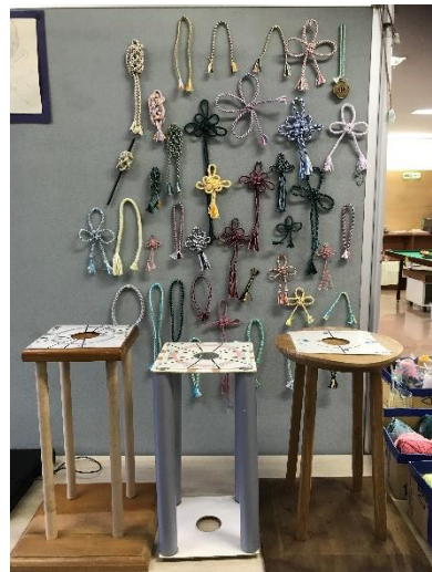
組みひもコーナー

ビリヤード台が新しくなりました。以前より台も玉も少し大きくなり、キューの数も増えました! みんなでナインボールなどをして遊んでいます。