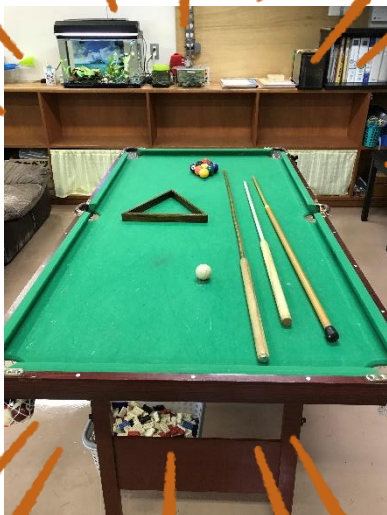
新しいビリヤード台