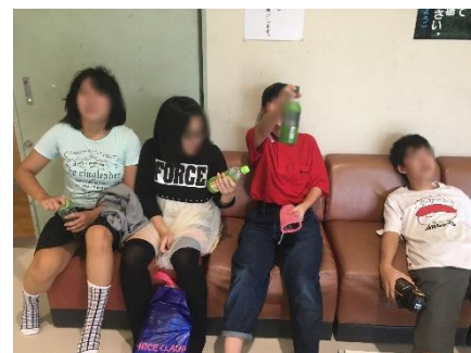
終わった時にはみんなへとへと