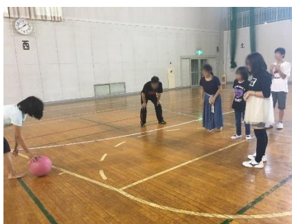
転がしドッジボール