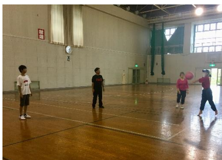
ソフトバレーボール

9月12日(水)、東野公園へ身体を動かしに行きました。ソフトバレーボール、転がしドッジボール、ボールあて鬼をしました。しっかり身体を動かし、汗もいっぱいかきました。子どもたちは、休憩時間にもボールで元気いっぱい遊んでいました。