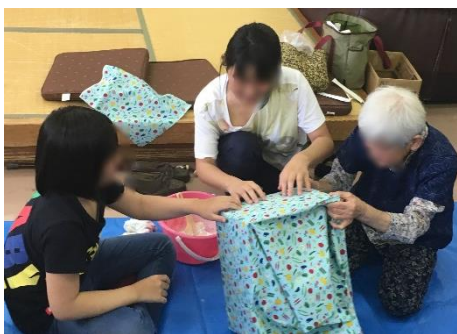
亀の会さんに教えてもらいながら段ボールのおもちゃ箱を作りました

9月19日(水)は、ボランティア団体「亀の会」さんとの交流会を行いました。小さい子どもたちが使うダンボールのおもちゃ箱を製作しました。それぞれ協力して作ることができ、しっかり働くことができました。また、昼食をみんなでいただきました。この日の昼食は、カレーライス、ポテトサラダ、果物の盛り合わせでした。昼食後、「あいあいっこ」へ作ったおもちゃ箱を届けに行きました。有意義な一日になりました。