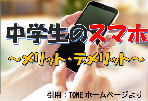
引用: TONE ホームページより