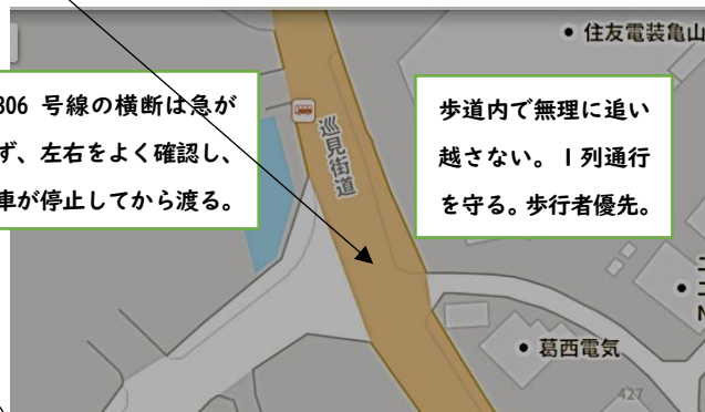
【みずきが丘北側出入口・消防北東分署前】