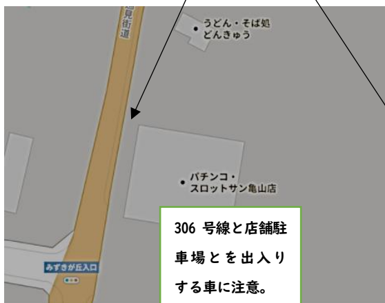
【中部中正門～みずきが丘東側出入口までの坂】